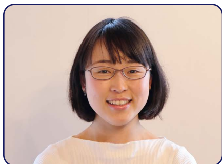
一般社団法人テンラボ ディレクター/名山新聞編集長