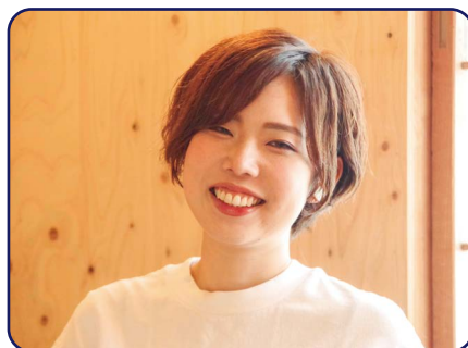
一般社団法人テンラボ プロデューサー