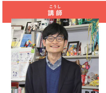
講師 かごしまだいがくほうぶんがくぶじゅんきょうじゅ 鹿児島大学法文学部准教授